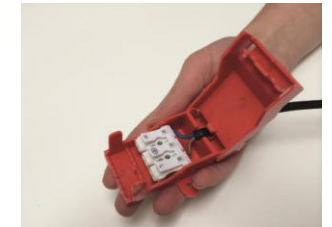
Ketjutusrasia MMJ:lle 3x1,5mm 2